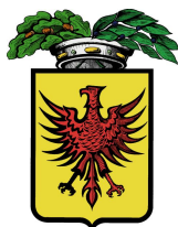
Provincia di Ravenna