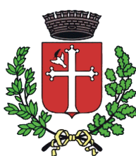
Comune di Lugo