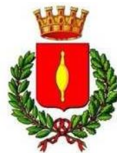
Comune di Fusignano