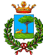
Comune di Alfonsine